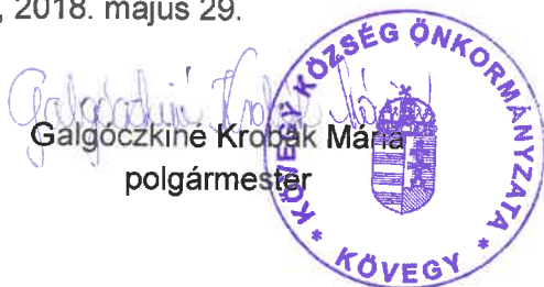
Galgóczi Krobák Mária polgármester